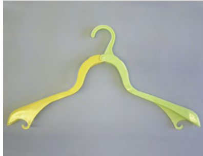
【グッパーハンガー】