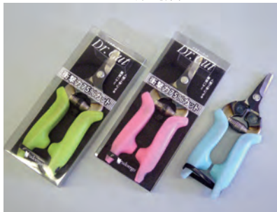
【Dr.Cut (ドクター・カット)】