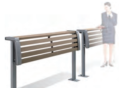
【サポートカウンター】