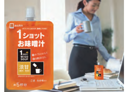
【1ショットお味噌汁】