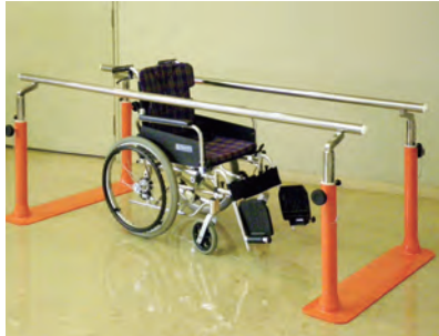
【S.P.P. (セーフティーパラレルポール)】