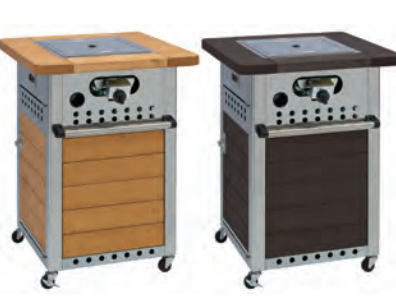
【溶岩焼きワゴンテーブル】