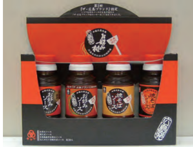
【みつわソース4種セット】